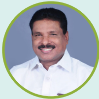
ചീഫ് എഡിറ്റർ എഴുതുന്നു