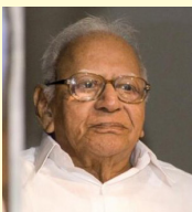
വി. ആർ. കൃഷ്ണയ്യർ