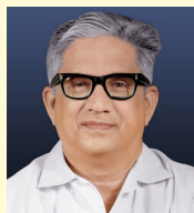
സി. അച്യുത മേനോൻ